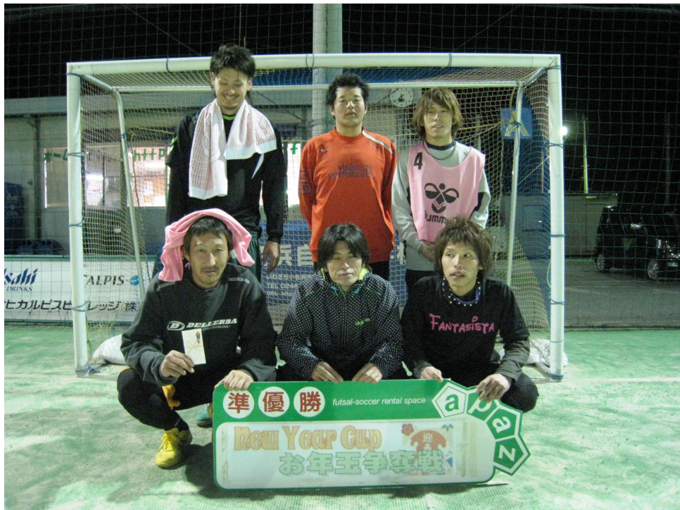
準優勝 芳賀コリアP