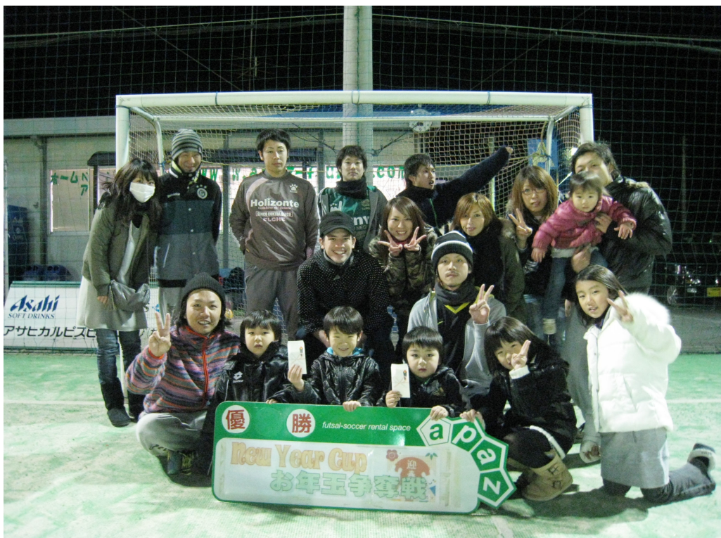
優勝 K タランチュラ