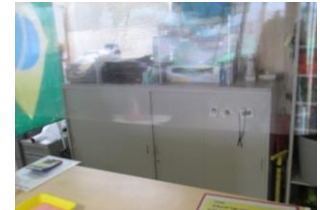
⑥飛沫感染予防の為、フロントにビニールカーテンを設置しております。