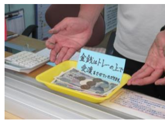
⑨金銭はトレーの上で受渡させていただきます。