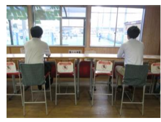
⑩目印を設置しています。密接にならないようご注意ください。