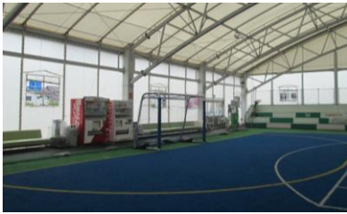
①密閉された空間とならぬ様、換気扇の巡回、開窓にて、空気を循環させております。