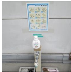
②手、指用の消毒液・手洗いの石鹸をご用意させていただいております。