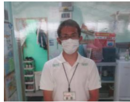
④当施設スタッフは、マスクまたはフェイスシールドを着用にて業務従事させていただいております。