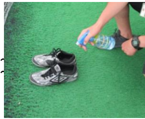
⑧共有する物品を使用後は消毒いたします。