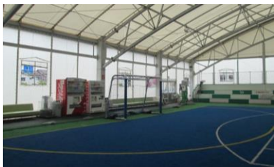
①密閉された空間とならぬ様、換気扇の巡回、開窓にて、空気を循環させております。