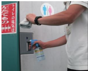
⑦施設内各所を定期的に消毒いたします。