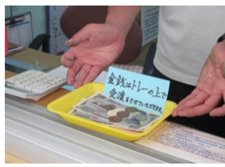
⑨金銭はトレーの上で受渡させていただきます。