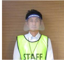
④当施設スタッフは、 マスクまたはフェイスシールドを着用にて業務従事させていただきます。