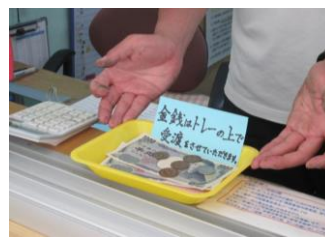
⑨金銭はトレーの上で受渡させていただきます。