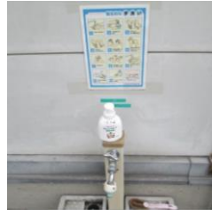
②手、指用の消毒液・手洗い用石鹸をご用意させていただいております。